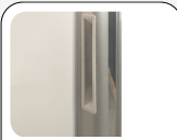
Poignée de porte en mousse