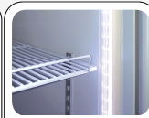
Lampe LED interne verticale