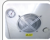
Ventilateur d'assistance interne